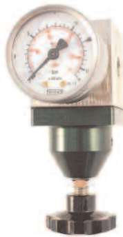
Manómetro de salida- / saída

As ilustrações, descrições e características são fornecidas a título de indicação. CAHOUE T em o direito de modificar seus produtos sem aviso prévio.