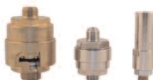
Type AHF 03/04/05